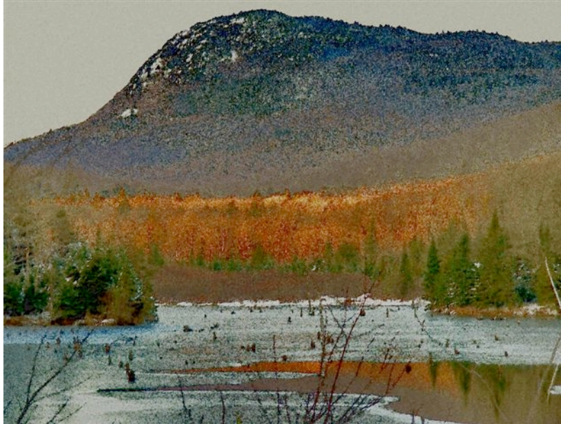
Mont Chauve

Traverser la montagne par le flanc Vers l'atelier du grimpeur Vers cet Atelier qui emprunte Les tracés de la recherche-crédation Renouveler nos gestes d'appartenance Nous dépouiller en plein janvier Ensemble jusqu'au sommet du mont Chauve Imprimer nos pas sur la neige Puis nous taire Quand la toile des tentes tremble au vent Quand la poudreuse nous enterre la nuit Quand les arbres craquent au froid Sous les drapeaux de prières Fragmentées