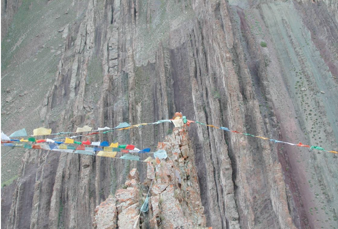
Stok Kangri