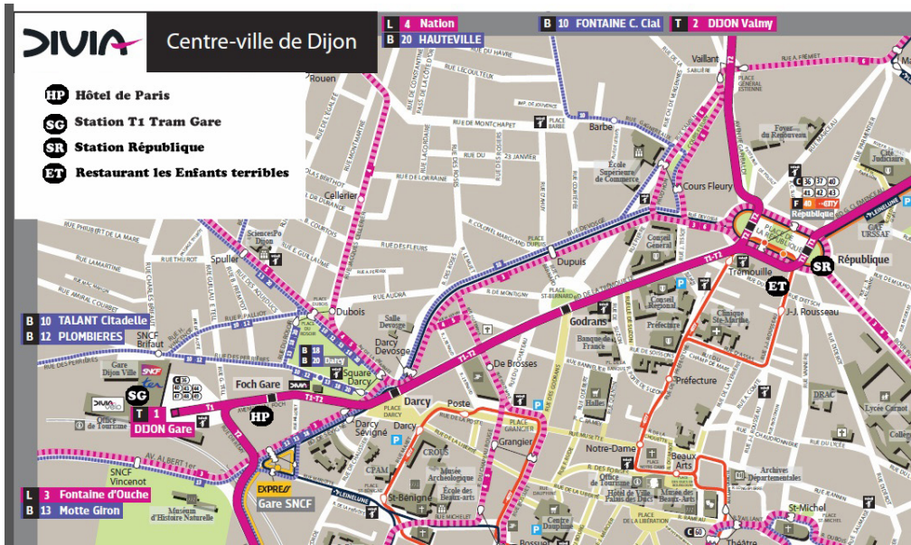
Tram T1 depuis la gare. Arrêt Erasme