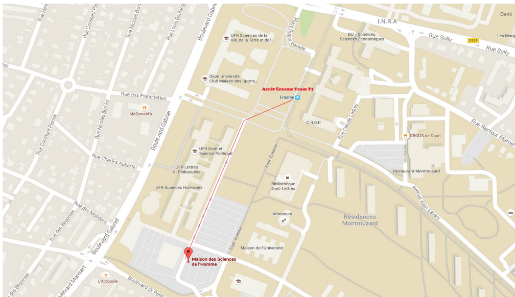
Amphi MSH, Maison des Sciences de l'Homme

Université de Bourgogne Franche-Comté, E.A. « Centre Pluridisciplinaire Textes et Cultures » (CPTC)